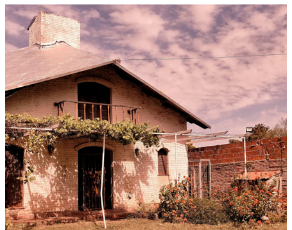
Casa de campo. Rafaela, Santa fe, Argentina. Ph.: Musuruana Agustín (2021)