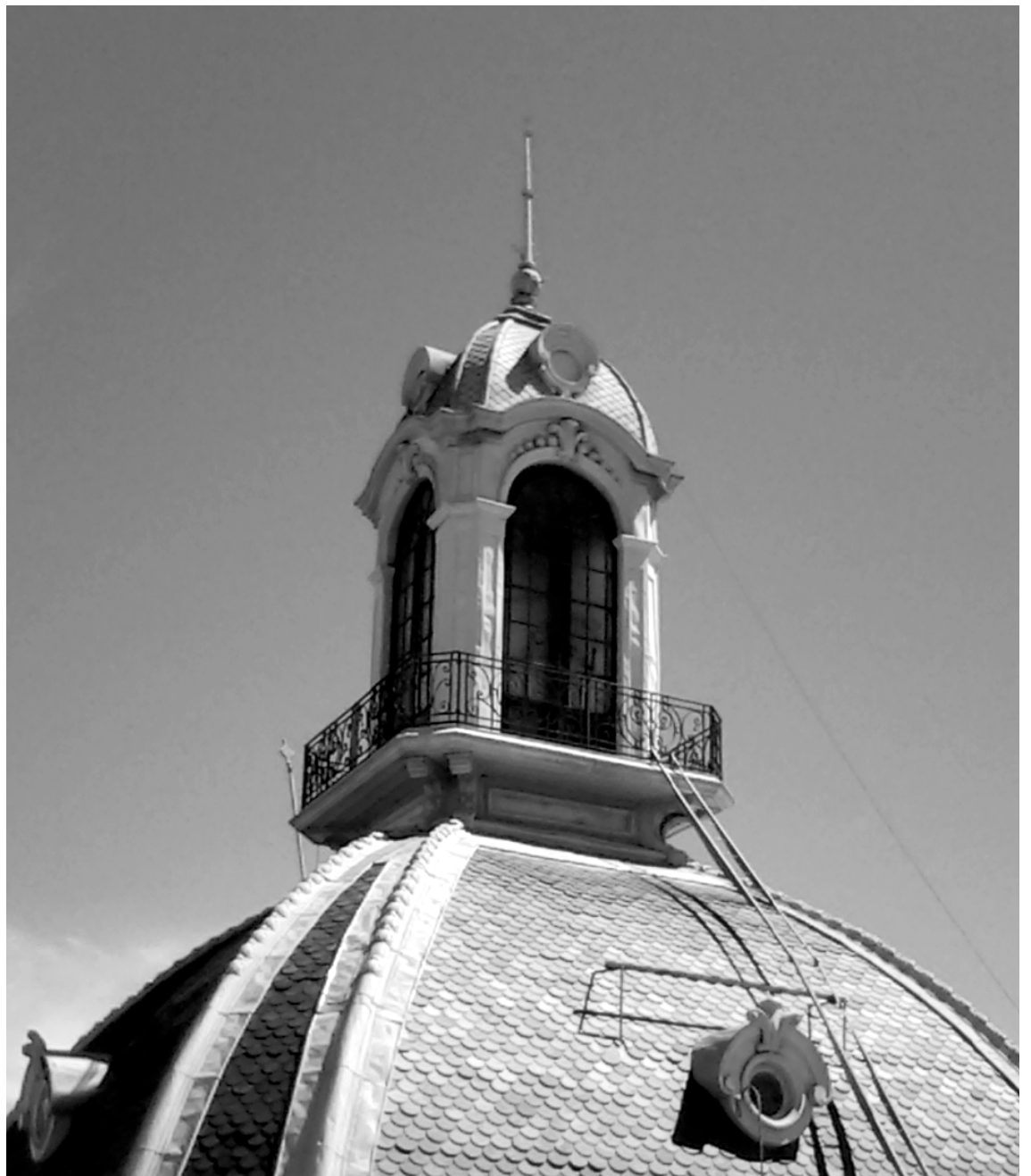
Cúpula de la Escuela Industrial Superior.