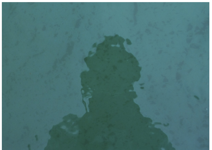
Autorretrato. Ph.: Musuruana, Agustín (2020)